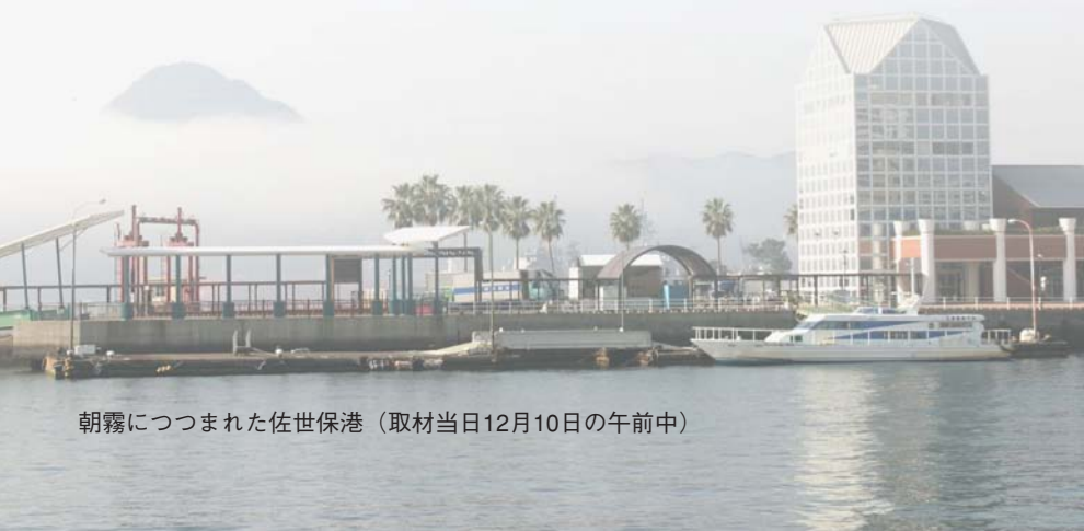
朝霧につつまれた佐世保港（取材当日12月10日の午前中）