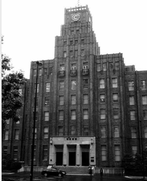
長崎市東京事務所が入る日比谷公園の市政会館

私が長崎市東京事務所に初めて転勤になった時は、県人クラブは銀座8丁目の「長崎センタービル」の中にありました。ビルには県人クラブ、長崎放送（NBC）、長崎新聞社、地下にある茶碗蒸しの「吉宗」が入っていました。「吉宗」では、今のように毎日チャンポンが食べられたわけではありませんでした。銀座のご真ん中、中央通りに長崎関係のビルが堂々として存在していることに驚いたのは今から27年前のことです。