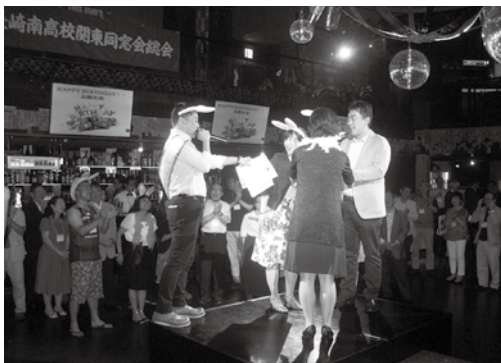
フォークダンスで楽しむ会員