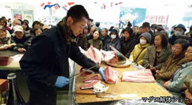
マグロ解体ショー

1周年記念日の3月7日には50キロを超える長崎県産養殖マグロの解体ショーが行われ、脂ののり