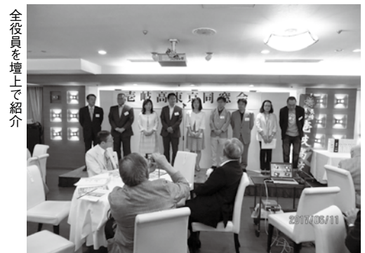
全役員を壇上で紹介

続いて来賓の紹介が行われ、対馬市議会副議長、対馬振興局管理部長、谷川衆議院議員秘書、長崎県東京事務所、東京〇岐雪州会、五島会、諫早会、平戸北松会、長