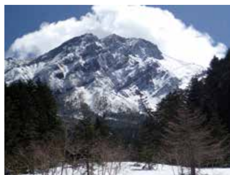
写真1 厳冬のハケ岳連峰赤岳(2899m)

54歳で退職後いくつか幸運に恵まれました。時間に余裕ができたうえに、戸建ての家を持つ代わりに、借地にキットの小さな山小舎を持ったこと、ゴルフや飲み会を節節することができたこと、友人から退職記念に山道具を贈られたこ