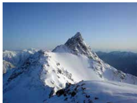
写真2 厳冬の北アルプス・槍穂の稜線から槍ヶ岳(3180m)

日本の山の魅力を挙げると、山容が悠然としていること、四季があること、朝夕の山の気が快いこととです。