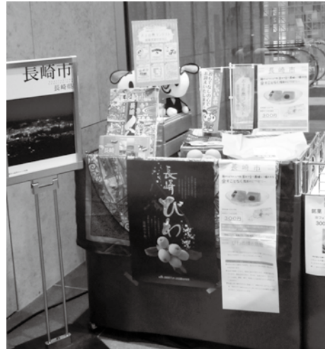
長崎市東京事務所展示品