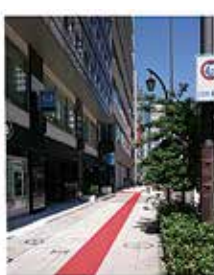
東京メトロ「日本橋」駅 87 出口を出てすぐ