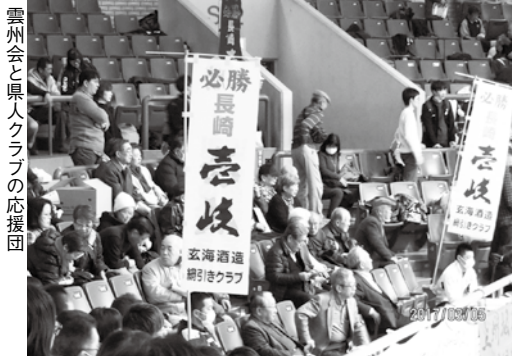
雲州会と県人クラブの応援団