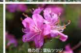
県の花：雲仙ツツジ